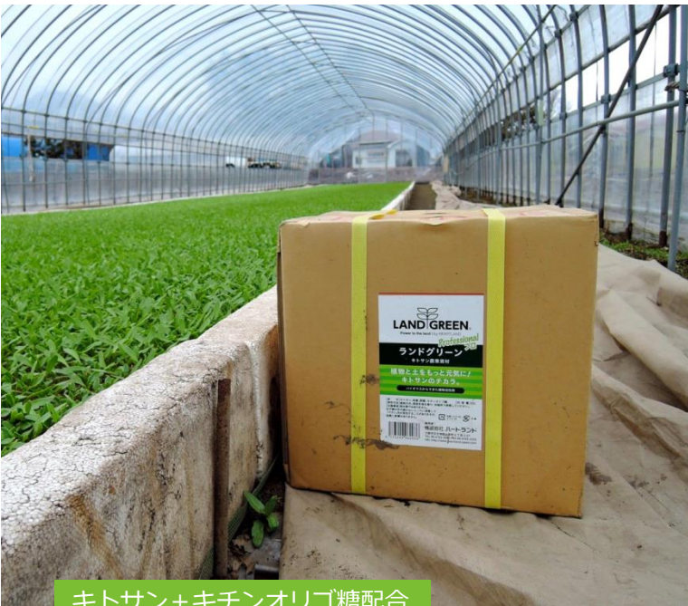
キトサン+キチンオリゴ糖配合

キトサンは、昆虫や糸状菌などの体に含まれている成分で、自然界には主にキチン質として、植物の生育環境中に豊富に存在していたバイオマスです。植物は昆虫や微生物との接触により、溶菌酵素キチナーゼなどを活性化し自らの体を守っています。